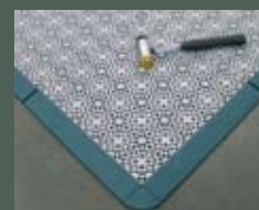
Kanten- und Eckleisten